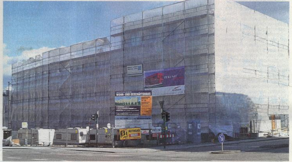
„Die Höhe der Nebenkosten wird in Zukunft eine wesentliche Rolle bei der Gebäudenutzung spielen“, glaubt Armin Zeiler – und hat deshalb ein Haus bauen lassen, dessen Energieeffizienz schon jetzt richtungweisend ist.

Meine Volksbank Regensburg eG Planungszentrum 1, 93047 Regensburg Telefon 0941 / 7840-0, Email: info@volksbank-regensburg.de